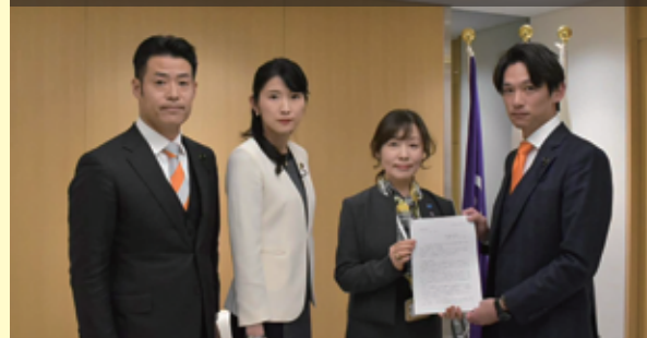
緊急記者会見を行いました